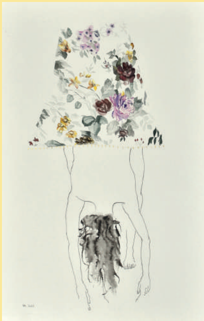
Femme fleur abat-jour © Aurélie Burette

Deux manuscrits originaux de l'Espace Georges Brassens, sortis exceptionnellement de leur réserve, seront présentés avec des textes explicatifs pour en souligner la richesse.